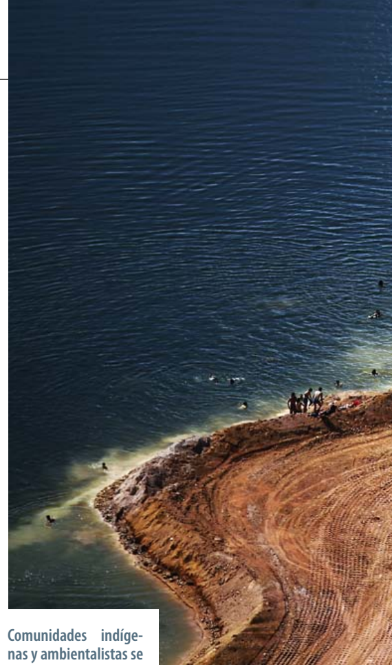
Comunidades indígenas y ambientalistas se oponen a los grandes proyectos que impactan fuertemente el medioambiente. Foto: Protestas contra el proyecto Belomonte en Brasil.