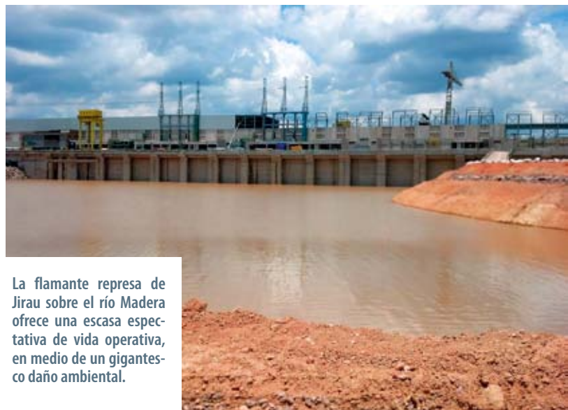
La flamante represa de Jirau sobre el río Madera ofrece una escasa expectativa de vida operativa, en medio de un gigantesco daño ambiental.

En cuanto hace a los tributarios del Madera, estos son estudiados más en Bolivia