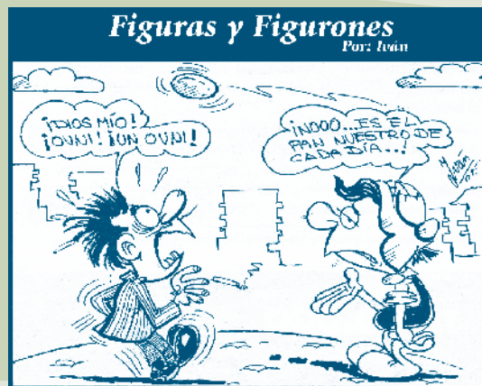
Figuras y Figurones