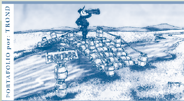
PORTAFOLIO por: TROND