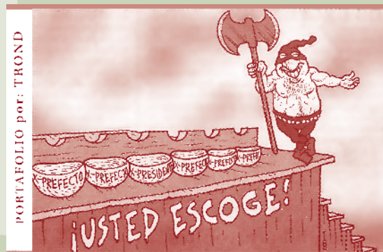
PORTAFOLIO por: TROND