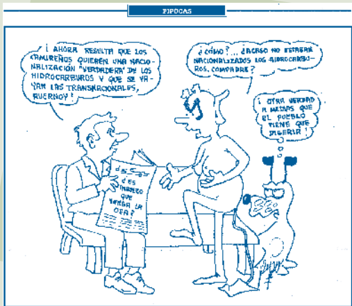
Los Tiempos 05-04-2008